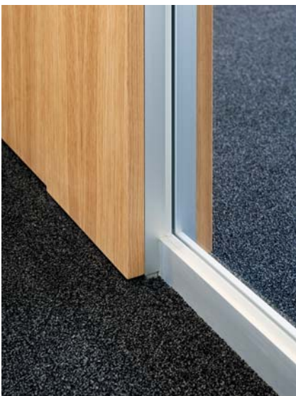
In den tragenden Aluminiumrahmen der Türelemente ist die Aufnahme für die angrenzenden Glasscheiben integriert.

Versicherung wurden die Schlitze auch gestalterisch genutzt: Mit einer Schlitzung 14/2 im 16-mm-Raster wurden insgesamt 7 800 m 2 Furnieroberfläche versehen. Die besondere Anforderung dabei war, dass die Trennwände auf beiden gegenüberliegenden Seiten akustisch wirksam sein sollten und trotzdem die Schalldämmung von Raum zu Raum zu gewährleisten war. Die Querwände weisen deshalb eine Sonder-Wanddicke von 12,5 mm auf. Die an den Bürozwischenwänden angrenzenden Glasschwerer wurden wegen der Schallschutzanforderungen in 18-mm-Verbundsicherheitsglas mit Schallschutzfolie ausgeführt. ■