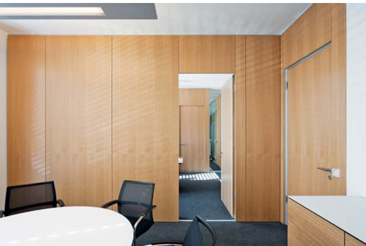
Zwei von drei Wandelementen der Bürotrennwände wurden beidseitig als geschlitzte Akustikelemente ausgeführt.

Wöhr Mieslinger Architekten (WMA) aus Stuttgart planten das neue Verwaltungsgebäude der R+V Versicherung. Es schließt eine Lücke zwischen zwei bestehenden Gebäuden und bietet 1300 Arbeitsplätze auf einer Bürofläche von 24 500 m 2 . Für den Innenausbau überzeugt optisch, technisch und wirtschaftlich die Systemtrennwand der Karlsruher Feco Innenausbau-systeme GmbH. Insgesamt sind bei dem sechsgeschossigen Bauwerk 16 500 m 2 Systemtrennwände mit 700 Türen eingebaut worden, davon entfallen ca. 7 900 m 2 auf Bürotrennwände. Diese sind als Vollwände in hellem Eichenfurnier im Raster 3 x 1,10 m in 3,10 m Raumhöhe und einer Wanddicke von 12,5 cm ausgeführt. Zwei der drei Wandelemente sind beidseitig mit akustisch wirksamen Oberflächen ausgestattet, um trotz der schallharten Oberflächen der Betondecke und der Glasfassaden eine angenehme Raumakustik zu schaffen.