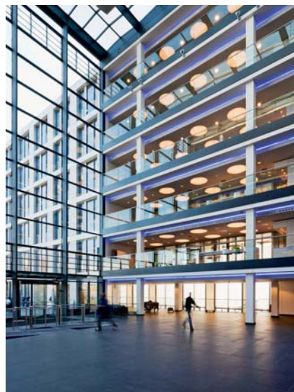
Der zentral angeordnete Zwischenbau verbindet die beiden Baukörper in Form einer großzügig verglasten, gebäudehohen Eingangshalle.

"Selber herstellen oder zukaufen? Ich will beides!"