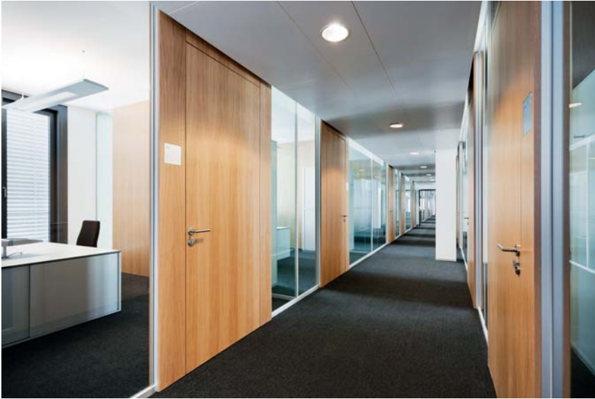
16 500 m 2 Systemtrennwände mit 700 Türen gliedern die Räume; Glaselemente erlauben den vollen Einblick in die Büros.

Das gesamte Türelement mit Ober- und Seitenteilen ist wiederum in einen stirnseitigen, tragenden Aluminiumrahmen gefasst, der gleichzeitig eine integrierte Systemaufnahme für die angrenzenden Glasscheiben aufweist. Der Scheibencharakter der Türelemente wird verstärkt, da keine zusätzlichen Glasrahmenprofile erforderlich sind und der Zargenspiegel überdeckt ausgeführt ist.