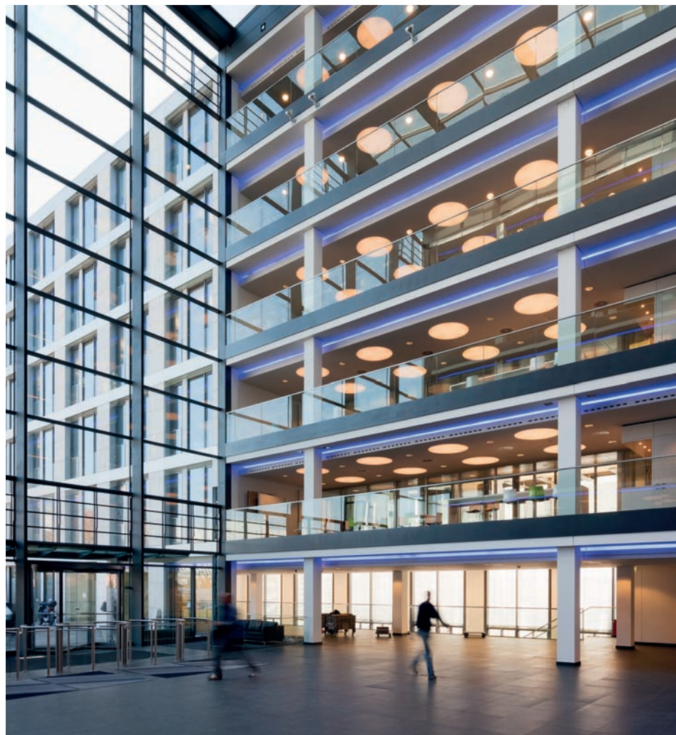
Zentraler Zwischenbau: Die gebäudehohe Eingangshalle verbindet die beiden neuen Baukörper.