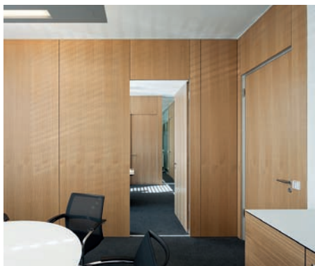
Im R+V-Gebäude wurden 17.800 m 2 fertige Furnier-Oberfläche verbaut, das entspricht 35.000 m 2 Rohfurnier.

sorbierenden Akustikelementen in geschlitzter oder perforierter Ausführung ab. Beim Neubau der R+V Versicherung setzten die Architekten geschlitzte Akustikelemente als gestalterisches Element ein. 7.800 m 2 Furnieroberfläche wurden dazu mit einer Schlitzung 14/2 im 16-mm-Raster versehen. Die besondere Anforderung war, dass die Trennwände auf beiden gegenüberliegenden Seiten akustisch wirksam sind und trotzdem die Schalldämmung von Raum zu Raum zu gewährleisten war. Die Querwände weisen deshalb eine Sonderwanddicke von 125 mm auf. Die an die Bürozwischenwände angrenzenden Glasschwerter sind aufgrund der Schallschutzanforderungen in 18-mm-Verbundsicherheitsglas mit Schallschutzfolie ausgeführt.